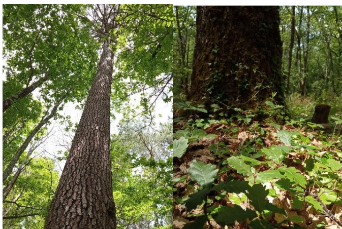
Figure 4 : Semis au pied d'un gros chêne (Boissière 2 mai 2021)