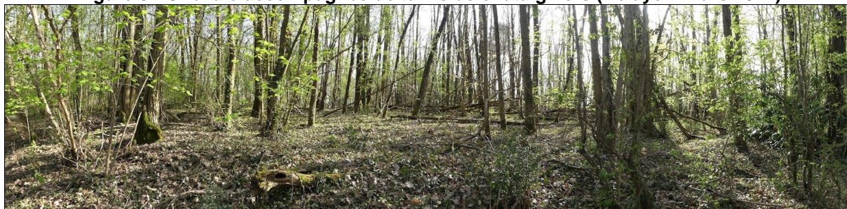
Figure 3 : Chênaie accompagnée de taillis de châtaigniers (Bélaise – mars 2021)

Implantée dans le Lot, l'association Cœur de forêt va venir compléter ce réseau d'acteurs. Depuis 2017, l'association propose un accompagnement engagé sur la gestion des bois. « Entre ne rien faire et tout couper », il existe de multiples possibilités pour gérer durablement ce milieu naturel en multipliant les objectifs (produire, protéger, accueillir...). En s'adressant aux petits propriétaires forestiers possédant moins de 10 ha en général, elle leur apporte une aide technique et financière. En contactant Cœur de Forêt, vous pourrez bénéficier d'un « portrait de propriété forestier », qui sera réalisé avec des conseillers forestiers indépendants locaux, mais pris en charge à 100 % par l'association. Ce document vous apportera une meilleure connaissance de votre patrimoine forestier (les aspects administratifs et réglementaires, les végétations forestières rencontrées, la description des peuplements et des sols, les itinéraires (conseils) sylvicoles possibles). C'est le socle à la prise de décision. Dès lors qu'une vision forestière sur le long terme sera envisagée (projet de transmission au sein de la famille, une gestion durable et raisonnée...), l'association pourra débloquer des financements et des accompagnements techniques plus importants. Par exemple, lorsque des travaux d'amélioration ou de conversion seront nécessaires, l'association peut prendre en charge jusqu'à 70 % du devis de l'entreprise dans la limite de 1000 € par Ha.