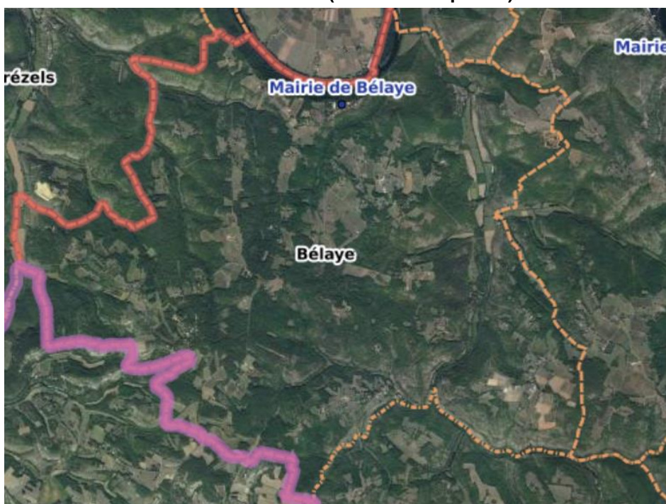
Carte de BELAYE

Dès la moitié du 18ème siècle, les secteurs de fortes pentes à versant frais comme le long du Lot ou celui du ruisseau de Rivel, apparaissent déjà très forestiers sur la carte de l'état-major. Les paysages ouverts se cantonnent sur les secteurs de plateau ou les versants très secs. Durant le 20ème siècle, la colonisation forestière se met en place par la déprise agricole. En comparant les photos aériennes de 1950-1965 et celles de 2006-2010, on remarque par exemple que la forêt s'est fortement étendue autour du lieu-dit de Bellegarde ou sur les versants secs sur la partie haute du ruisseau de Rivel.